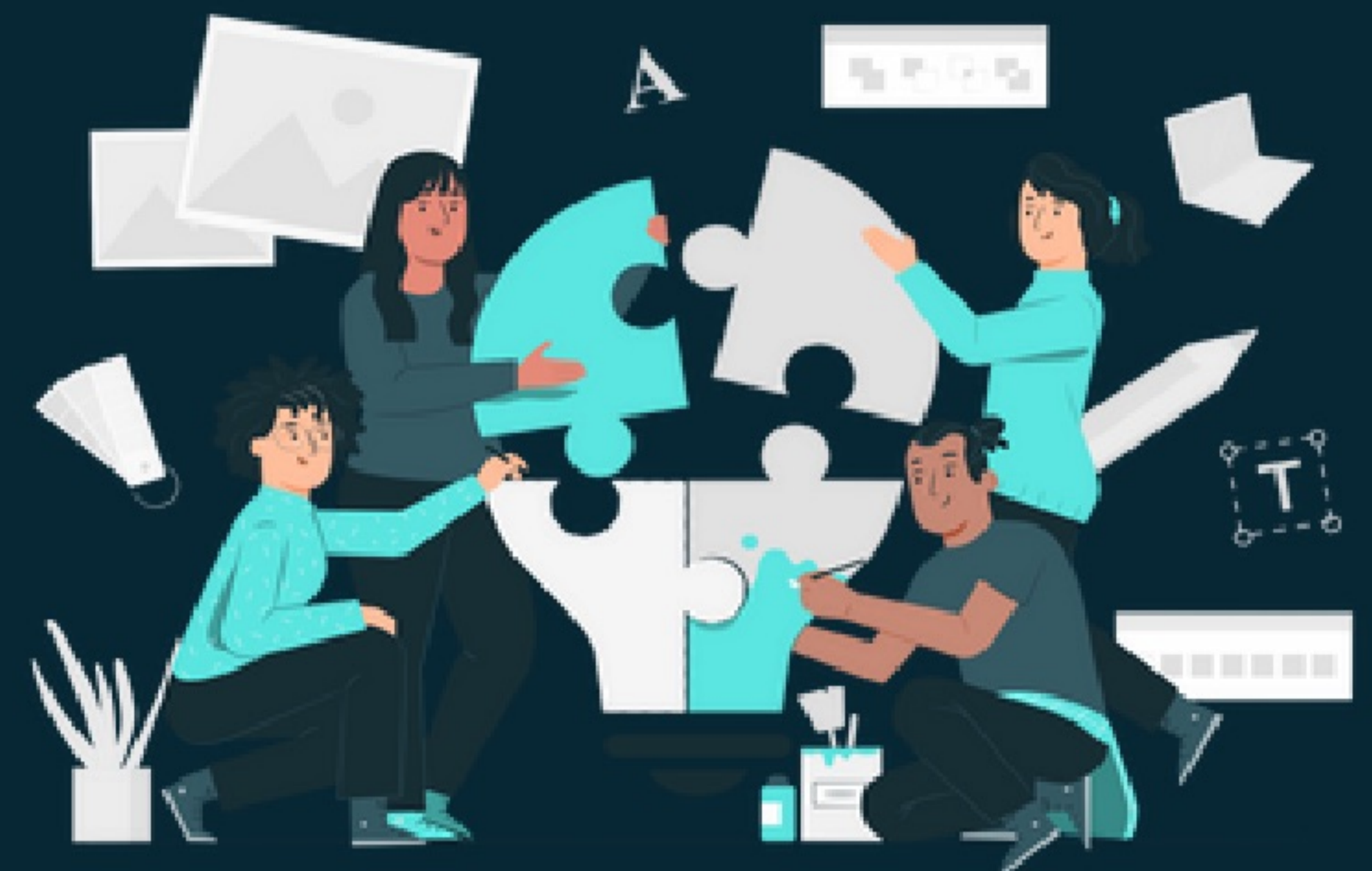
INNOVA TECH Solutions

Unser Team besteht aus zwei Jungunternehmern, die mit Begeisterung an innovativen Lösungen arbeiten.