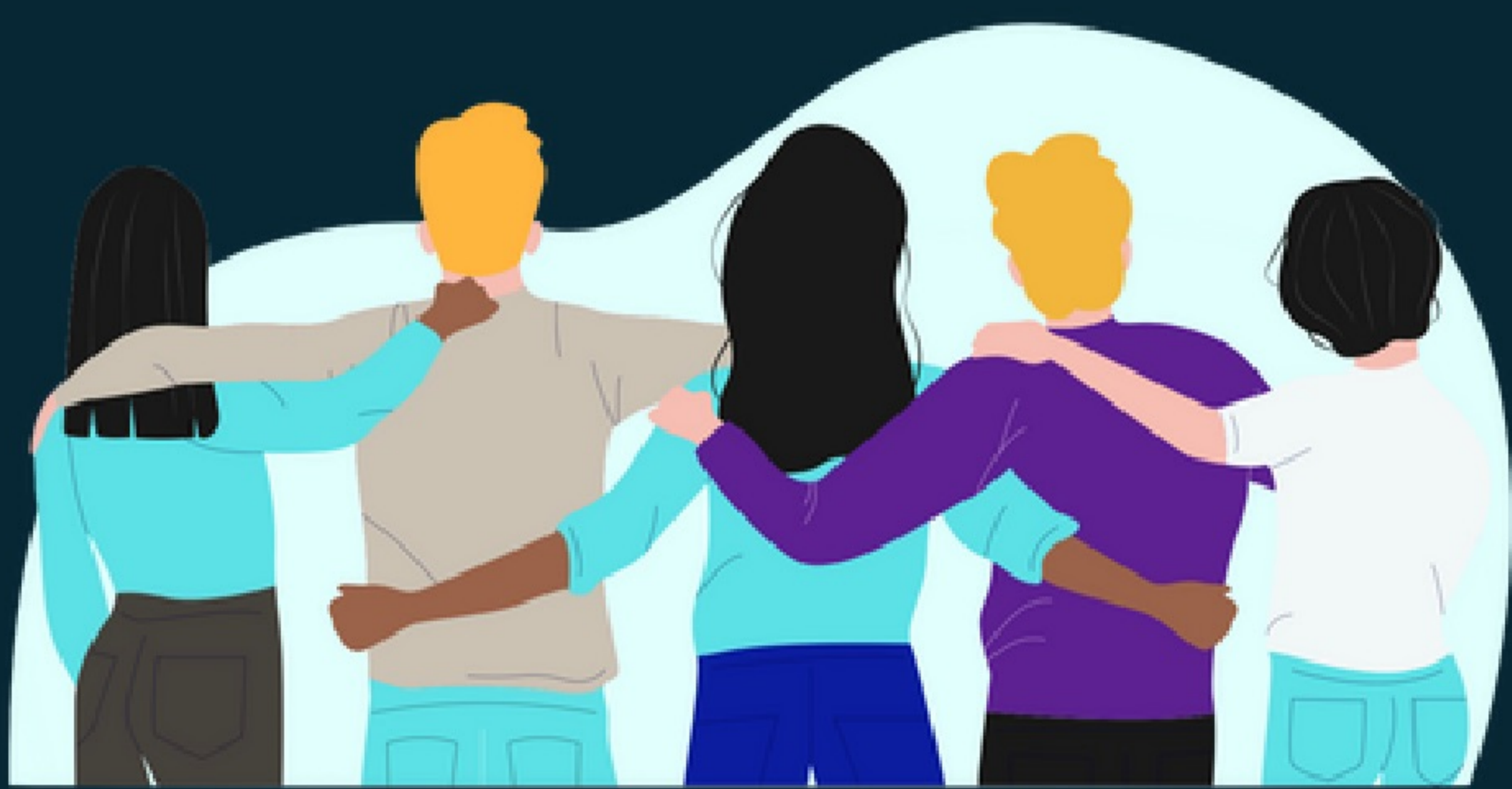
INNOVA TECH Solutions

Mit einer Prise Kreativität, unseren Fachkenntnissen und einem starken Teamgeist setzen wir spannende Projekte um und lassen Ideen zum Leben erwachen.